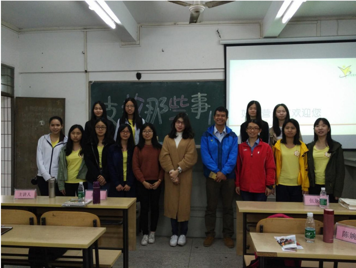
图片 | 2017 年好友营支教在佛大开办宣讲会