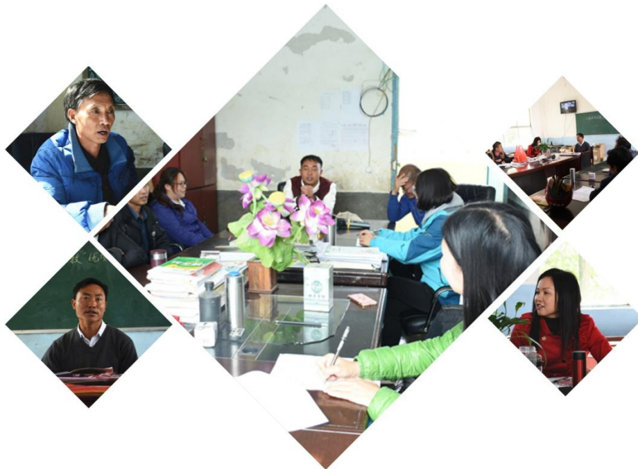
图片 | 2017 年 11 月佛山顺德聚胜小学老师到贵州支教学校提供教学支持

2017 全年共收到约 452 份报名表，最终合计通过 68 人，共 58 人最终完成支教。支教志愿者分赴湖南省郴州市、永州市，贵州省六盘水市，青海省西宁市共 9 所村小学支教，受益 1336 名学生。培训方面，我们继续优化了团建与教学培训环节，培训方案趋于成熟稳定。从 2017 秋支教的整体情况来看，效果比较理想的。对一线支教老师的日常支持与管理，也有长足进步，教学督导、岗位分工更到位。支教专员一线走访合计 12 次，平均每月一次，行程包括拜访支教点所在的教育局与中心校。另外，与佛山多所优秀小学保持联系，包括顺德凤翔小学、聚胜小学，禅城区环湖小学等，从中我们得到非常好的教学支持。