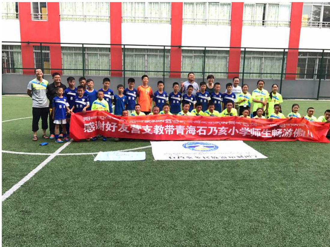
图片 | 2017年“带青海孩子游广佛”