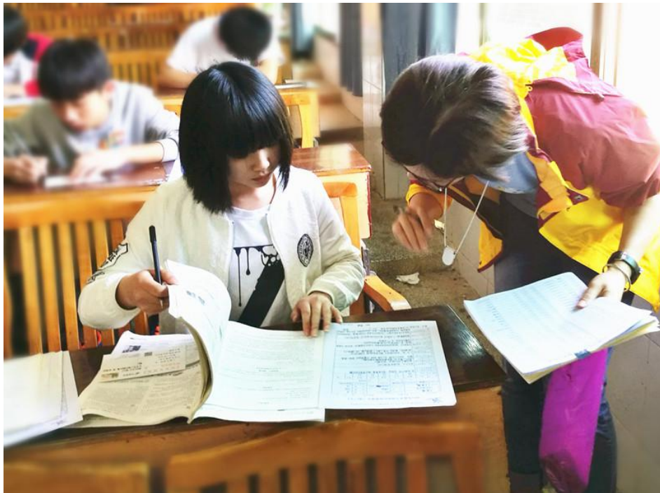
图片 | 资助组同事走访资助学生

2017 年度进行资助发款走访 4 次，一共资助学生 853 人/次，收到资助款 73.17 万元，资助款发放 75.75 万元，升学结案 35 位，其他结案 25 位，5 位学生复读，新增资助人 70 位；走访学生、照片整理、反馈发送，以及长期跟资助人和学生联系沟通贯穿整年。另 2017 年度进行两次学生家庭走访，一共走访 104 户学生，通过资助申请的学生有 84 位，参加走访志愿者有 24 位。